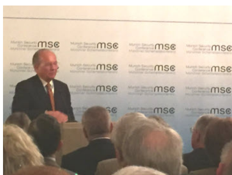
Bild: Botschafter Wolfgang Ischinger MSC 2017

Die Vorstände des Vereins sind auch dieses Jahr mit viel Interesse und einer hohen Erwartung an die Referenten der Einladung des Aktionskreis für Wirtschaft, Politik und Wissenschaft (AKWPW) , zum traditionellen Treffen im Rahmen der Münchner Sicherheitskonferenz gefolgt.